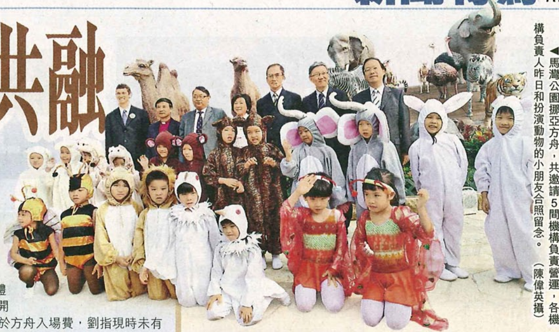
馬灣公園挪亞方舟，共邀請5間機構負責營運，各機構負責人昨日和扮演動物的小朋友合照留念。(陳偉英攝)

▼馬灣公園挪亞方舟分為五層，設有多媒體博覽館及珍愛地球館等，供市民參觀。 (陳偉英攝)