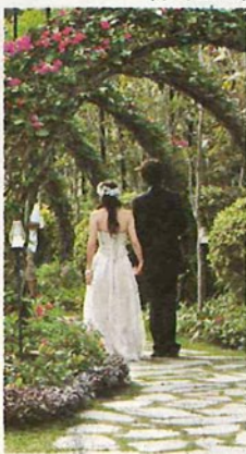
◆翠綠園林，勢成拍結婚照的取景勝地。