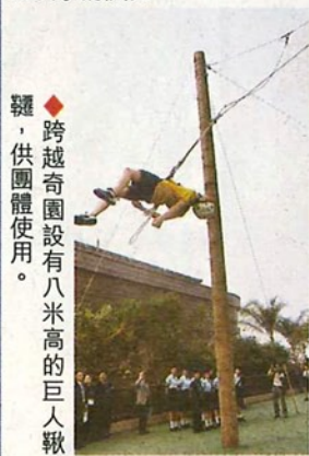
◆跨越奇園設有八米高的巨人鞦韆，供團體使用。